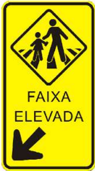
Fig. 01- Modelo da placa de sinalização viária (item 2.5).